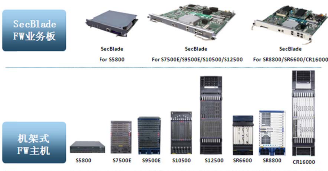
SecBlade FW 模块外观

SecBlade FW 模块与基础网络设备融合，具有即插即用、扩展性强的特点，降低了用户管理难度，减少了维护成本。